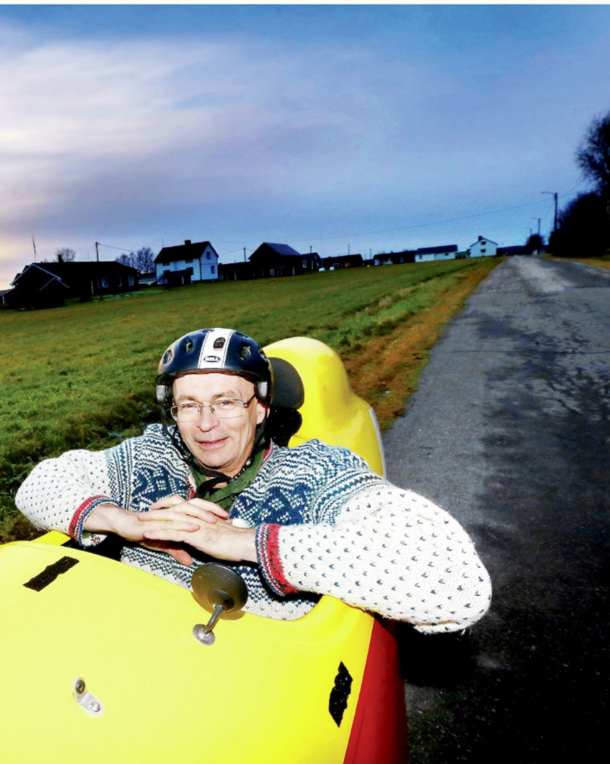
matsvinnet i den lokala butiken i Juoksengi, där han bor.